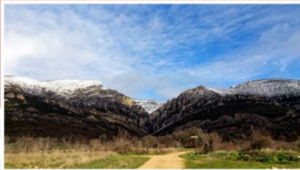
Valle de Valdivielso