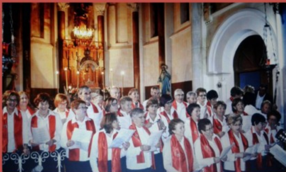
Coro de Valdivielso